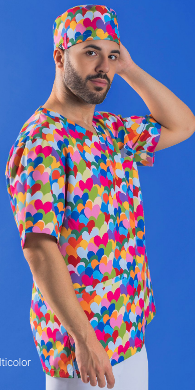
c/5149 Cuore multicolor