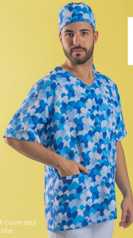
c/5146 Cuore azul Cuore blue