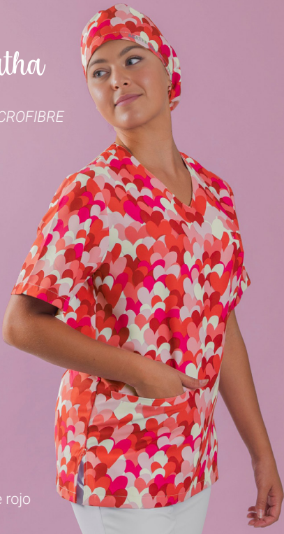
c/5147 Cuore rojo Cuore red

Unisex MICROFIBRA/MICROFIBRE 148 gr/m 2 100% PES XS-XXL