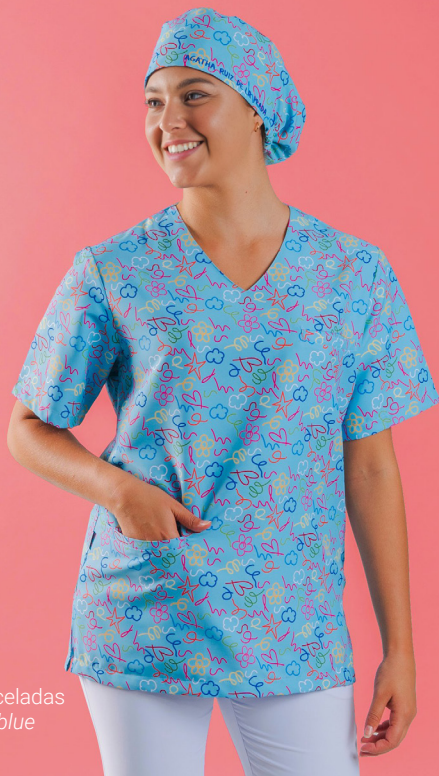
c/5153 Pinceladas Pinceladas blue