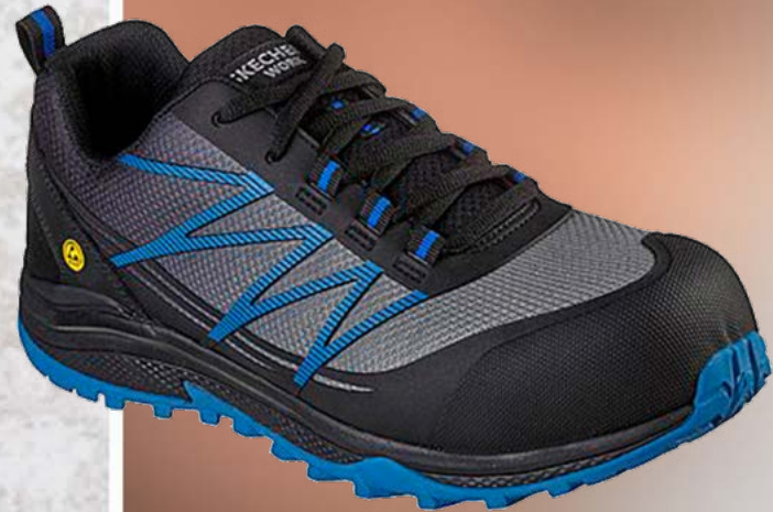
REF. SK200046EC PUXAL COMP TOE