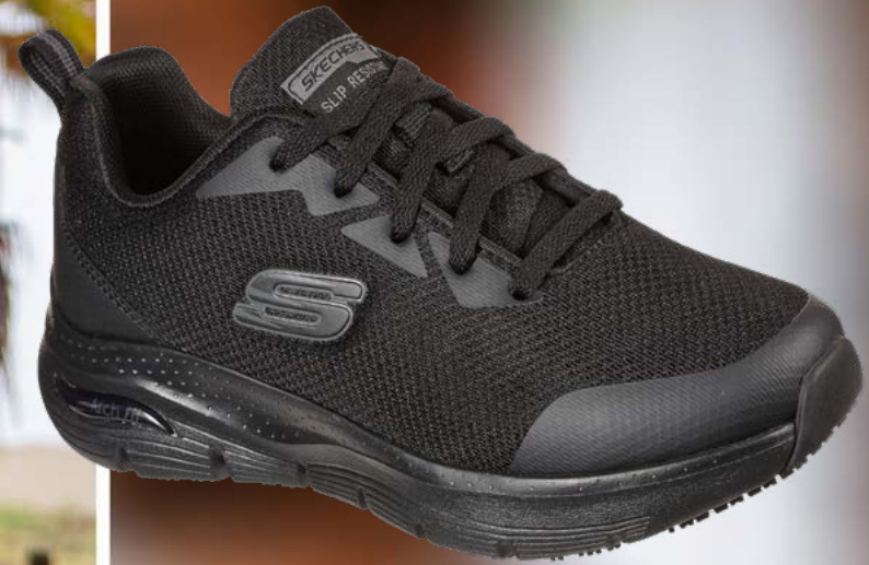
REF. SK108019EC ARCH FIT SR