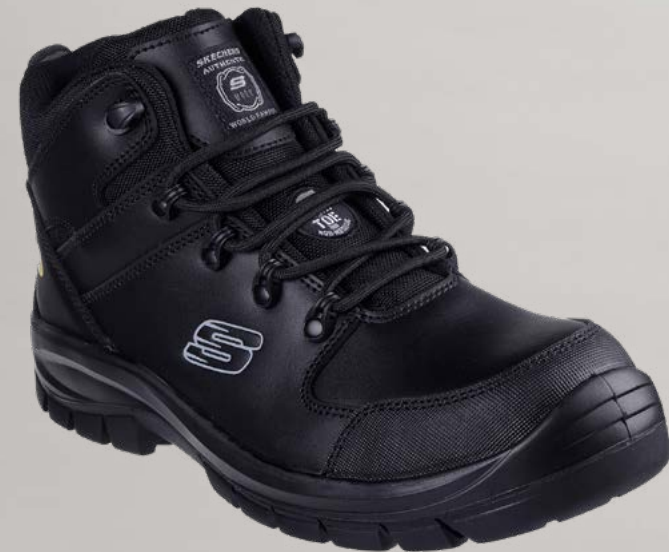
REF. SK200187EC TROPHUS - PENDING