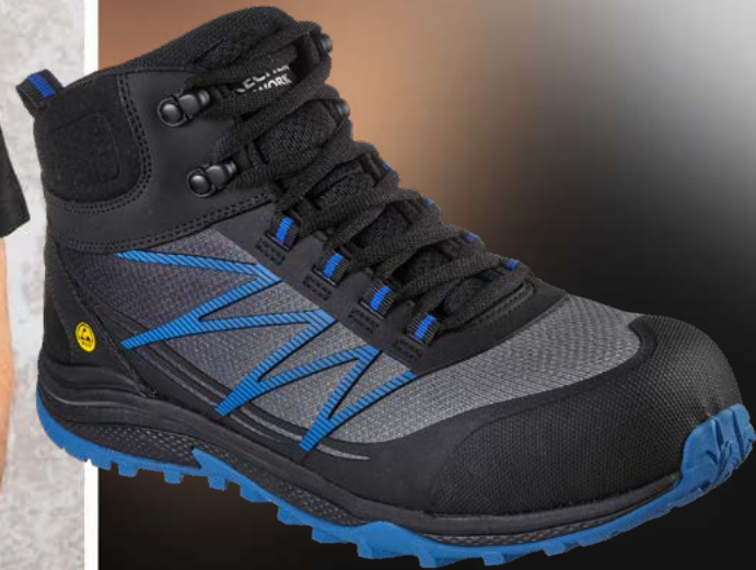
REF. 200047EC PUXAL FIRMLE