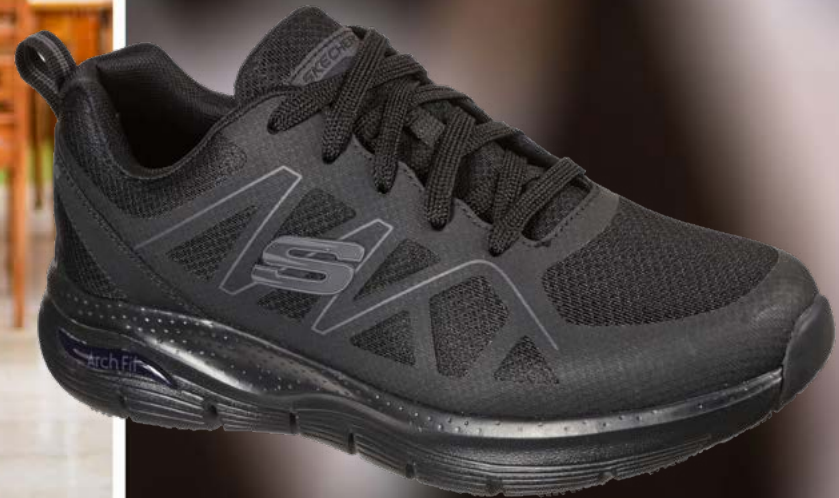
REF. SK200025EC ARCH FIT SR - AXTELL