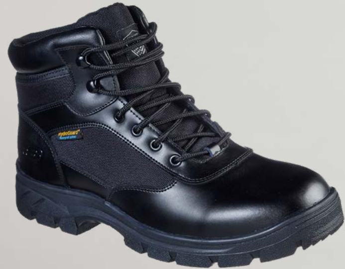
REF. SK77526EC WASCANA - BENEN WP